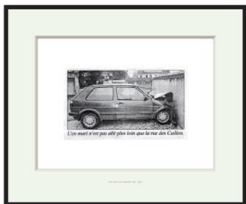
Taroop & Glabel, Les belles images de Taroop & Glabel : L'ex-mari n'est pas allé plus loin que la rue des Caillots - Collection Fonds national d'art contemporain, Paris et courtesy Galerie Sémiose, Paris

La série intitulée Les belles images de Taroop&Glabel (2009) est composée ici de 18 tirages, des agrandissements de photographies accompagnées de leur légende parues dans la P.Q.R (la Presse Quotidienne Régionale) qui, au premier regard, pourrait passer pour de l'art conceptuel par son mode de présentation. En s'approchant, on découvre une compilation de scènes de vie ou de faits pauvres en information. Cette banalité appelle des légendes qui sont elles-mêmes porteuses d'images et d'anecdotes et qui empilent les clichés (festivités, faits divers, vie conjugale, vie de quartier...). Loin d'être transfiguré, le banal est renvoyé à la permanence standard de ses représentations.