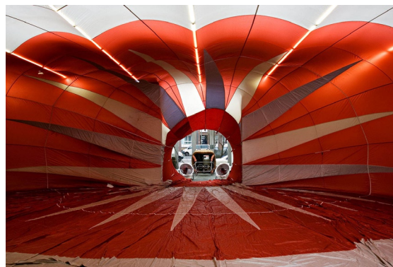
Kris Martin, T.Y.F.F.S.H. , 2009

Pour sa première exposition en France, Kris Martin présente T.Y.F.F.S.H. (2009), une montgolfière couchée dans l'espace d'exposition qui renvoie au thème romantique et universel du désir de voler. Mais cette métaphore de la liberté est transformée en antre, sinon claustrophobe, du moins frappée de pesanteur. Car la montgolfière est ici lestée au sol par le « White Cube ». Au-delà de ses qualités plastiques d'un espace dans l'espace, l'œuvre de Kris Martin évoque l'histoire légendaire du ventre de la baleine.