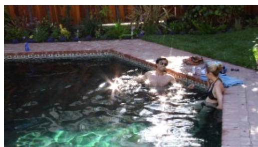
Alain Della Negra & Kaori Kinoshita, Life (extrait), 2009 Courtesy des artistes et Capricci, Nantes - © Alain Della Negra & Kaori Kinoshita

Life présente la vie de différents personnages, ou « résidents » de Second Life , catégorisée en trois films qui résument pour les artistes les trois grands pôles d'attraction de la vie humaine : le sexe ( Sex ), l'argent ( Money ) et la spiritualité ( God ). À la fois sujet traité et outil de rencontres, le monde virtuel de Second Life leur permet de donner une vision de l'Amérique californienne actuelle. Les surprenantes porosités entre la vie réelle et cette existence virtuelle laissent affleurer les préoccupations de nombre de protagonistes : le devenir de l'être humain dans le futur, son évolution possible, voire souhaitée, vers le transgenre et/ou l'homme-machine.