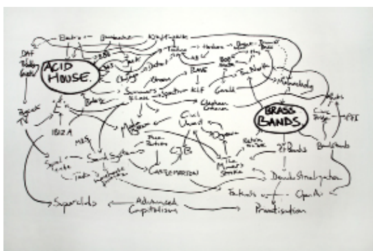
Jeremy Deller, History of the World , 1997 Courtesy Galerie art:concept, Paris - © Jeremy Deller

Ici, un enregistrement de dix hymnes d'Acid House joués par la fanfare de Williams Fairey est diffusé, associé à un wall painting de l'artiste : un schéma très dense et dynamique qui relie entre eux par des noms (de villes, de groupes, de courants, de concepts) ces deux phénomènes socio-musicaux.