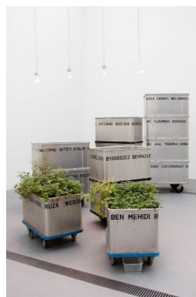
Franziska & Lois Weinberger, Mobile Landscape , 2003 Courtesy des artistes -©Franziska & Lois Weinberger

La pratique de Lois et Franziska Weinberger intègre également différents médias (dessin, photographie, texte, installations sculpturales ou vidéos) pour des productions toutes caractérisées par une vision critique des phénomènes de société, générant des espaces physiques et imaginaires qui affirment leur dimension anarchique et fortuite au regard d'un monde normé. Même s'ils ont réalisé un grand nombre de projets à l'extérieur, Lois et Franziska réalisent des œuvres pour les espaces d'expositions, notamment les « jardins transportables » et les Mobile Landscape . Des containers métalliques sont remplis de terre, trouvée la plupart du temps dans des terrains vagues, dans laquelle les artistes plantent des graines de « Ruderal ».