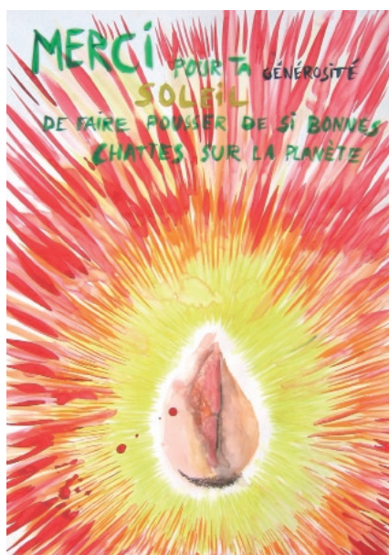
Jean-Xavier Renaud, Merci pour ta générosité soleil , 2009 © Jean-Xavier Renaud

À l'Institut, Jean-Xavier Renaud présente une soixantaine de dessins, selon un accrochage que l'artiste a voulu « organique », se construisant au fur et à mesure des glissements de sens et associations d'idées, à l'image de la profusion propre à sa production. Les scènes insolentes ou hilarantes, flirtant souvent avec le mauvais goût, s'accumulent, pour un portrait de l'humain dans toute sa splendeur. Des œuvres plus récentes (à l'huile sur toile ou à l'aquarelle sur papier) fonctionnent en séries, comme les Winners ou les Nativités . Parfois, de purs paysages, notamment ceux de la région d'Hauteville où vit l'artiste, apparaissent comme une respiration salubre, même s'ils racontent au fond la même chose, mais en creux.