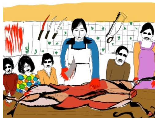
Noëlle Pujol, Elles étaient une fois, monmon... , 2009 © Noëlle Pujol

Comment s'inventer une mère pour mieux l'imaginer ? Voilà le défi que s'est lancé Noëlle Pujol, qui a fait le choix du dessin réalisé à la palette graphique pour construire le portrait imaginaire d'Ascension Garcia, chez qui elle fut placée à l'âge d'un mois. Objet de terreur et de fascination, cette suite graphique, fragments d'un conte multimédia contemporain décrit une histoire d'amour entre deux femmes empêché par le « calque du pouvoir ». Elle s'inscrit dans une démarche d'expérimentation, et en particulier de confrontation des technologies numériques au monde du cinéma documentaire.