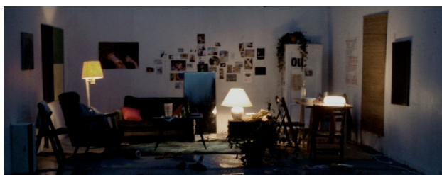
Véronique Boudier, Nuit d'un jour (extrait), 2008 - Courtesy de l'artiste et Galerie Chez Valentin, Paris - Véronique Boudier

Nuit d'un jour est un morceau de temps. Film d'action, à suspens, avec ses éclats, ses montées d'adrénaline, dans un temps qui semble être celui du présent. L'image se consume alliant beauté à l'idée de violence et de destruction. Mais le cycle ne s'arrête pas là et l'image détruite laisse apparaître le paysage nouveau et sans fin. Tout se joue ici. À l'instant où le décor bascule. Il n'est, alors, plus question de situer ou de définir la réalité. Véronique Boudier nous montre simplement, que nous voyons autre chose. L'artiste produit un suspens d'émotion qui renvoie chaque spectateur à faire l'expérience directe de sa présence réceptrice