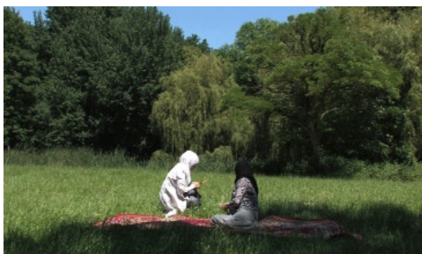
Florence Lazar, Les gardiens (extrait), 2009 - Courtesy de l'artiste © Florence Lazar

Réalisé dans la Cité les Bosquets à Clichy-Montfermeil, Les Gardiens , présenté à l'Institut, met en scène deux femmes voilées assises sur un tapis au milieu d'une pelouse. Dans la Perse antique, le tapis représentait l'utopie du jardin, les conditions du désert ne permettant pas d'en voir fleurir de vrais. Placé uniquement à l'intérieur, il symbolisait un territoire imaginaire que l'on gardait chez soi. Ici, c'est l'inverse : la sphère privée devient sphère publique et le tapis devient le lieu d'une visibilité dans l'espace public. Sans que cela ne transparaisse à l'image, cet endroit bucolique est rapidement perturbé par le bruit d'un chantier puis par une conversation masculine en parallèle et à proximité. La concurrence entre les deux récits passe de la superposition au brouillage, pour finir par déplacer la scène supposée de l'action.