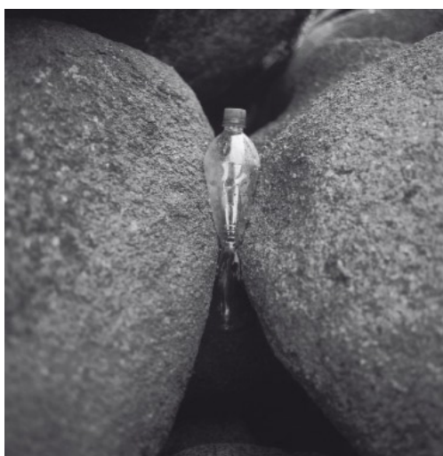
Jean-Luc Moulène, Régulier , Barneville, 24 janvier 2008, 2009

Les œuvres en volume présentées ( Chrome, 1999 ; Météo, 2009 ) associent également une dimension construite, standardisée (matériau, usage, ex. tuyau d'arrosage) à un arrangement inattendu, une torsion de forme et de sens.